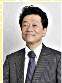
ファイテン株式会社 代表取締役

業績：158億7800万円（H22.4） ファイテンショップ：国内136店・海外96店